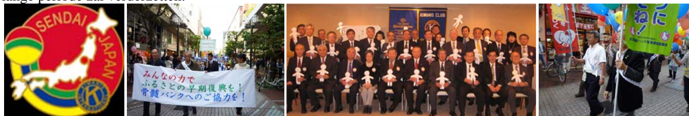
"Charmant, aangenaam en heilzaam" is de slogan van de actie van de Kiwanisclub van Sendai Voor meer details over deze club bezoek volgende website: http://sendaikwanis.com/indexe.html

Dit fonds startte haar activiteiten op 1 december 2011. Men verwacht dat ze haar werkzaamheden gedurende een lange periode zal verderzetten.